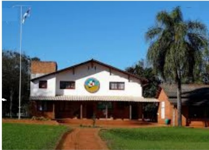
Ecole secondaire Linea Cuchilla (Argentine)

Les deux communautés sont chacune des minorités en voie de disparition. Elles représentent un enrichissement de la présence religieuse locale et ont une signification ecclésiale et sociale qui va bien au-delà de ce que leur taille pourrait laisser croire. Comme