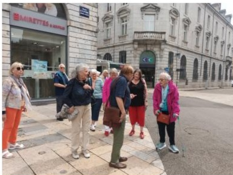
En attendant le petit train

La période celtique, la période romaine, la période moyenâgeuse, la période bourguignonne, la période sous le Saint-Empire, la période sous Louis XIV, la période sous la Révolution, la période industrielle, voilà autant d'épisodes historiques qui ont dû laisser des traces dans cette ville que nous nous réjouissons de découvrir durant le séjour qui nous attend.