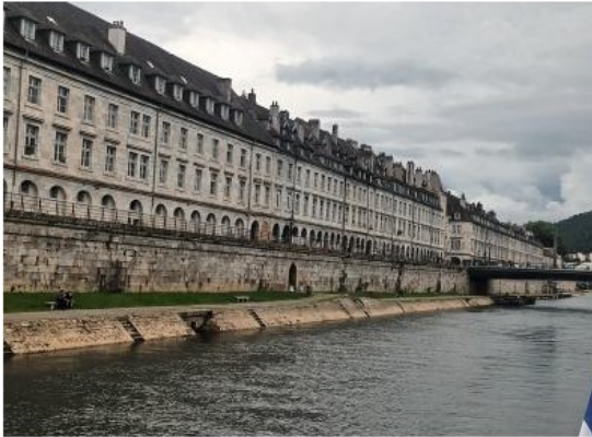
Le quai Vauban

Nous rentrons à pied à notre hôtel et la soirée se poursuit avec notre repas du soir dans un bon restaurant de la place.