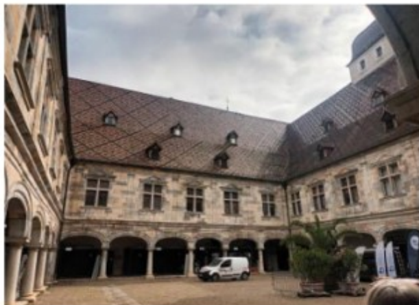
Le palais Granvelle qui abrite le musée du temps

de rotation de la terre sur son axe polaire, sachant que le plan dans lequel oscille le pendule, lui, ne varie pas.