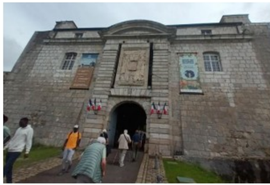
L'entrée de la citadelle

Arrivés au parking, nous descendons du train et continuons à pied en remontant les ponts et traversant les portes des fortifications.