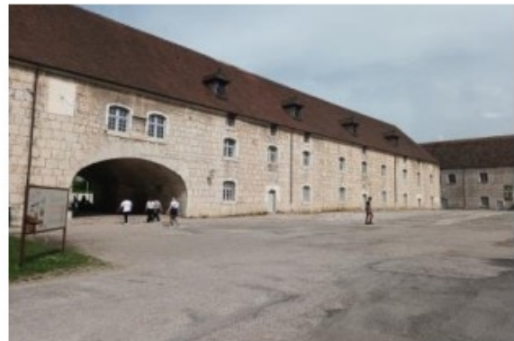
A l'intérieur des murs

La zone fortifiée mesure quelques 11 hectares nous dira la guide durant la visite. A toutes les époques, l'éperon rocheux sur lequel nous nous trouvons a été un objet de défense convoité par le pouvoir. En 1674, au terme d'un siège de 27 jours auquel assiste le roi Louis XIV en personne, la citadelle tombe aux mains du royaume de France et le roi Soleil s'empresse de confier les travaux de consolidation et de fortification de la place au maréchal Vauban. C'est ce dernier qui donnera à la citadelle l'aspect que nous lui connaissons aujourd'hui.