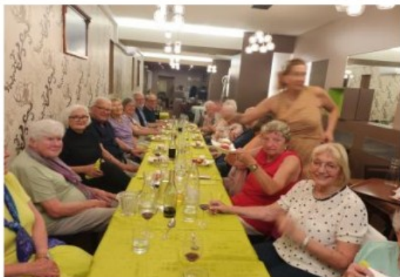
Notre 1er souper aux " 4 Saisons "

C'est au restaurant "Aux 4 saisons" que M. Lantz a réservé pour