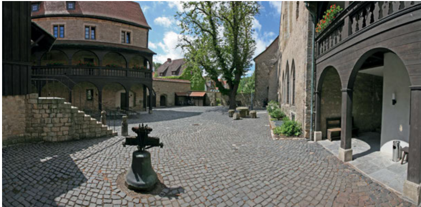
Innenhof Augustinerkloster, Erfurt

Am 31. Oktober 1517 veröffentlichte Martin Luther 95 Thesen über den Ablasshandel. Ein Ereignis mit weitreichenden Folgen. Luthers Thesen lösten grosse Auseinandersetzungen über den Glauben aus und führten schliesslich zu neuen Kirchen. Fünfhundert Jahre später, 2017, soll das Ereignis der Reformation gebührend gefeiert werden, zusammen mit Ihnen! Sie sind eingeladen, mit uns zu feiern und an der Frage zu arbeiten, was dieses Erbe für uns Reformierte heute bedeutet – und in Zukunft. Mitglieder anderer Konfessionen sind ebenfalls herzlich eingeladen! Wir wollen gemeinsam Wege in die Zukunft suchen.